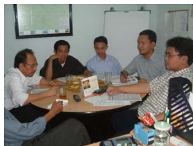
Rapat pleno Pengurus Pusat PPSDMS setiap hari Senin pagi